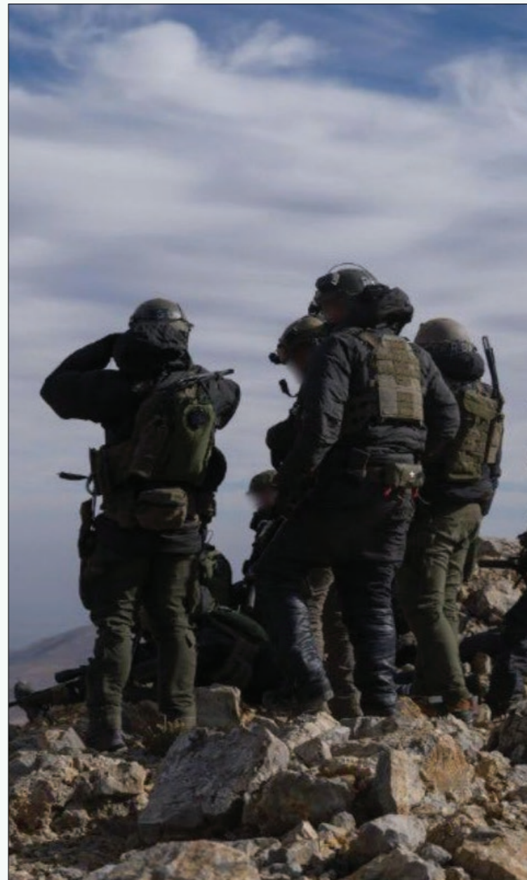
وحدة عسكرية من الجيش الإسرائيلي على الجانب السوري، من قمة جبل الشيخ جنوبي سوريا - 9 كانون الأول 2024.