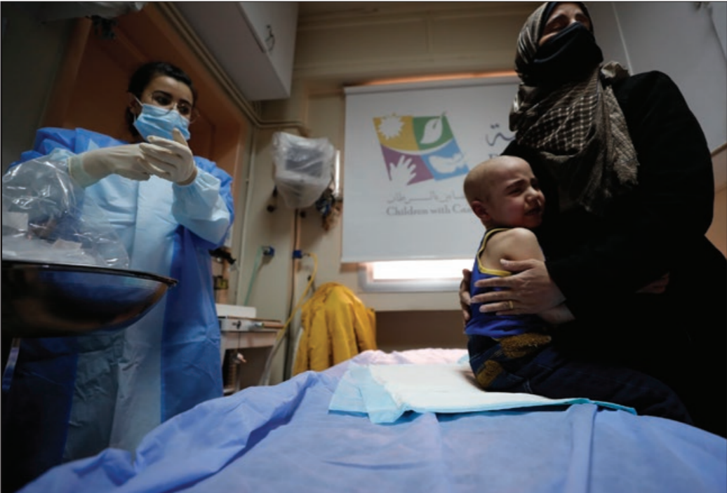
أم مع طفلها، في قسم علاج مرضى السرطان بمستشفى الأطفال في دمشق - 7 أيلول 2022، IAPi