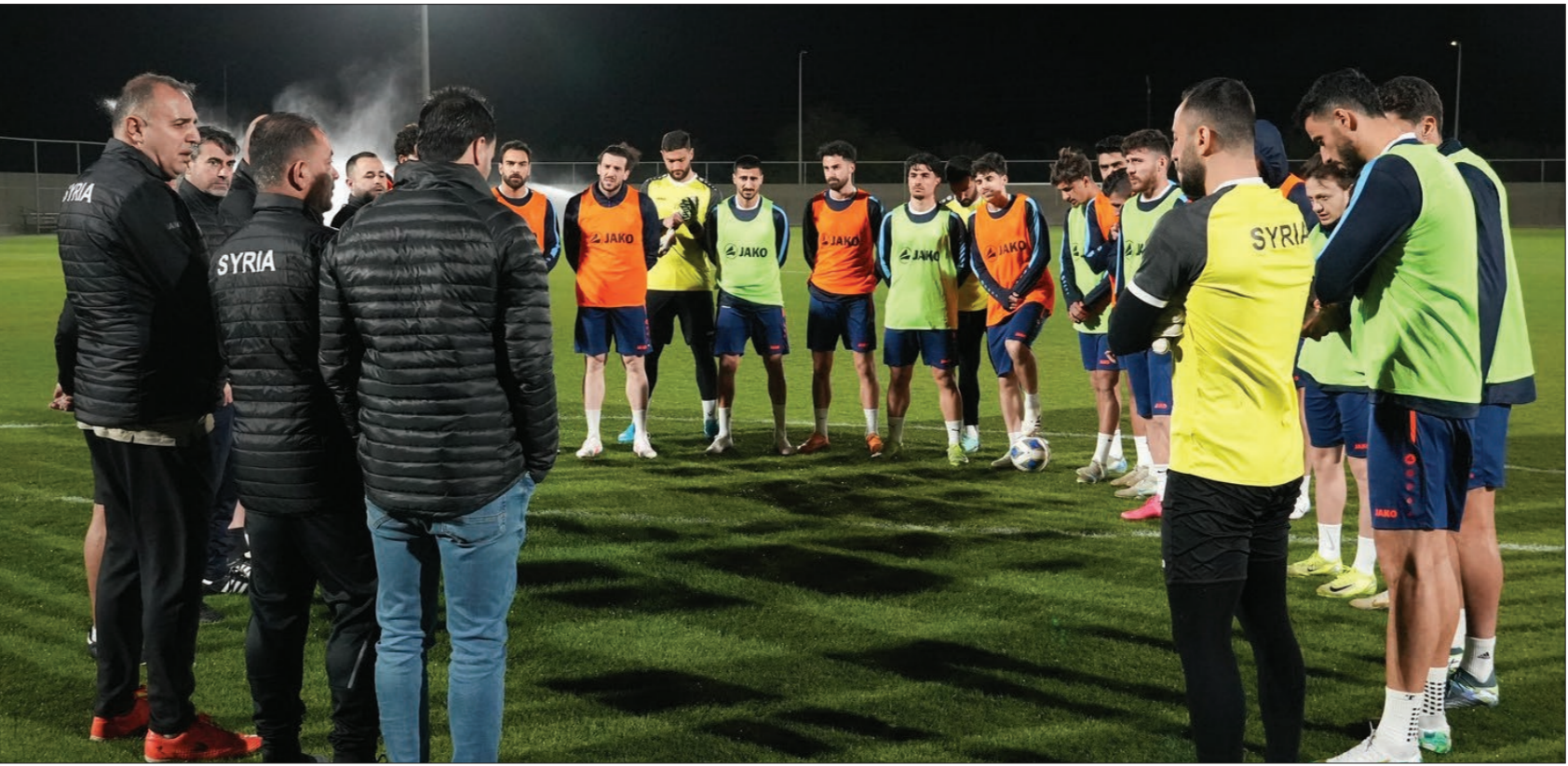
المنتخب السوري لكرة قدم خلال حصة تدريبية استعداداً لتصفيات كأس آسيا - 21 أيار 2025