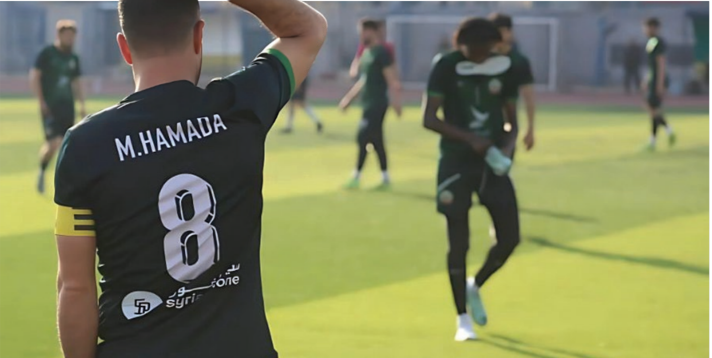
نادي أمية يستعد لطاولة "العربي السوري الحر" في رجب - 19 شباط 2025 لنادي أمية الرياضي

وتستعد الأندية لخوض مرحلة الإياب، إذ انتهت مرحلة الذهاب بصدارة نادي خاني تحفيق القاب برصيد 20 نقطة، ونادي أمية في المركز الثاني بنقاط القاط (20 نقطة) ويتخلف بفارق الأهداف، وعندان ثالثاً بـ 17 نقطة.