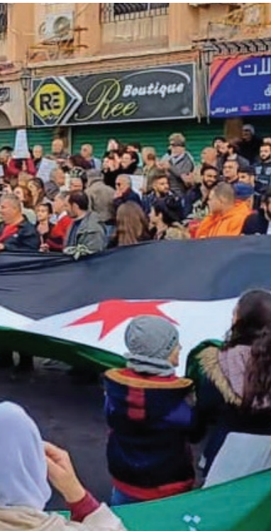
سوريون يرفعون علم على اوحدة قوطية في ساحة الكرامة بسويداء - 13 كانون الأول 2024

من "عرب 48" في المجتمع الإسرائيلي كماي أقلية تتمسك بالدولة لحمايتها. ويرى أنّ النظام عزل الدروز عن القضية الوطنية بأدوات منهجية، والسلطة الجديدة تعمل بذات الأدوات وذات الخطاب، والهجوم على الدروز هو