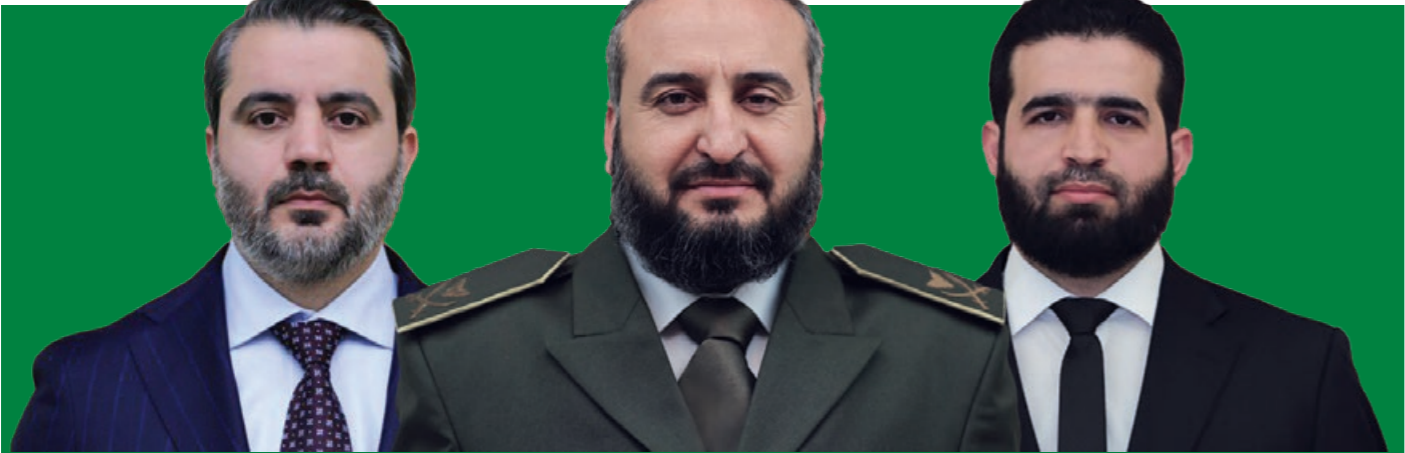
وزير الخارجية السوري أحمد الشهباني وزير الداخلية علي خطاب وزير دفاع حوسه أبو حمزة التشنل عنب بلدي

المعنية بالأمن (الدفاع، الاستخبارات، الخارجية، الداخلية، وغيرها) لضمان وحدة القرار والتنفيذ.