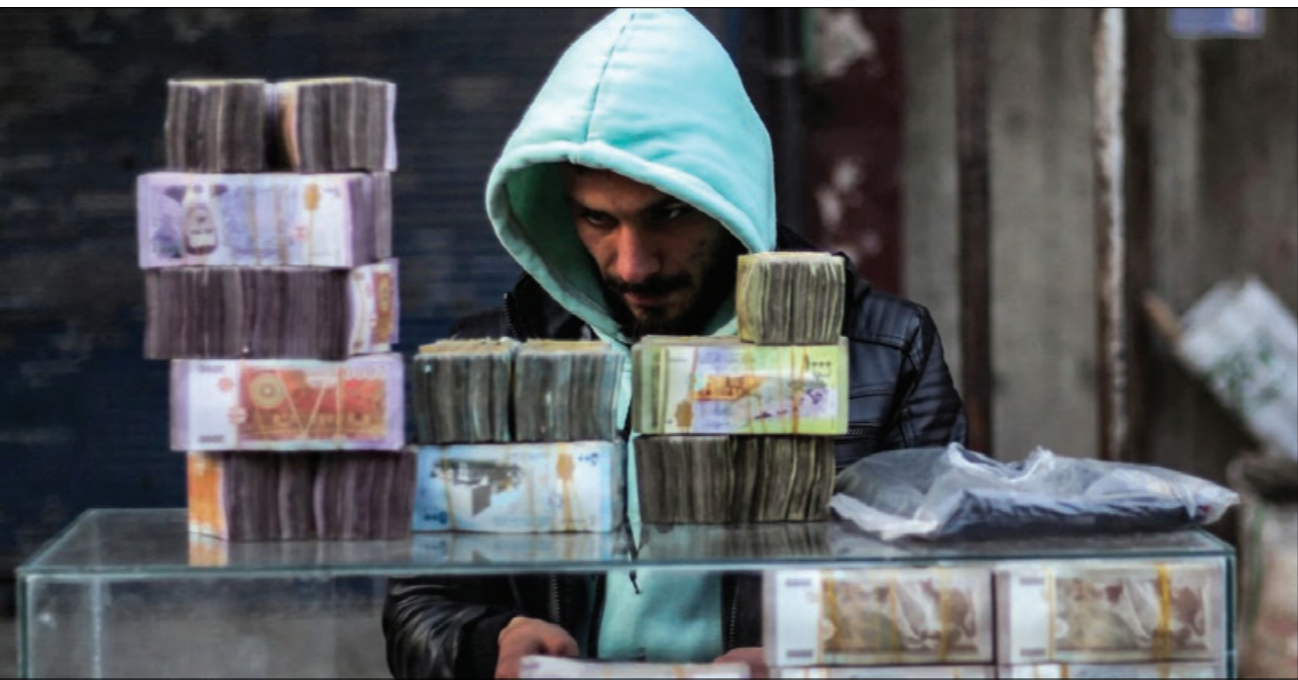
محل لتصرف العملات في سوق بدمشق فتح في محافظة حلب شمالي سوريا - 4 كانون الثاني 2025

الدولار، لكيلا يهجم التجار بارتفاع أو انخفاض الليرة السورية، ولكن هناك مشكلات مع المستهلك الذي يدفع