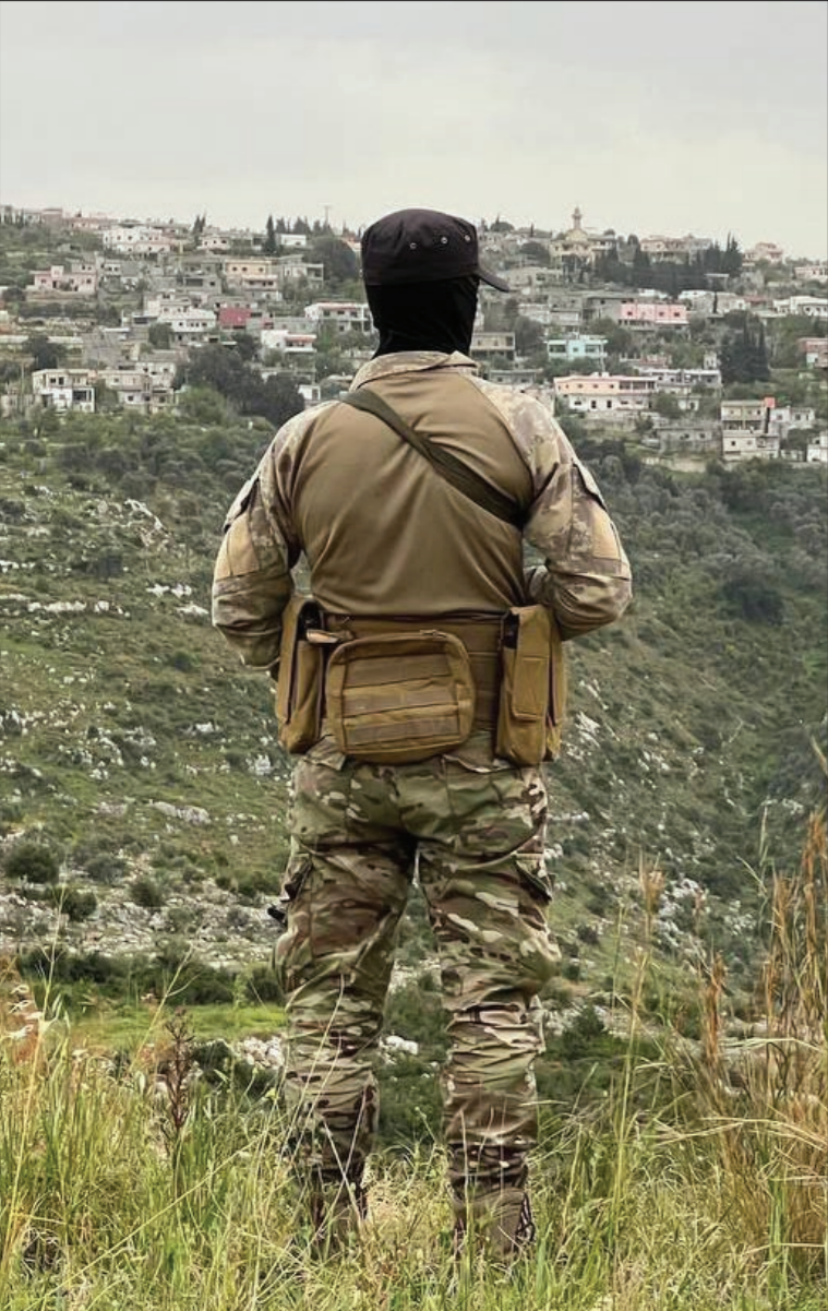
نشر عناصر الأمن العام في قرية حرف بنمرة بريف بانياس بعد حادثة قتل ستة مدنيين - 1 نيسان 2025 محافظة طرطوس

كما يجب العمل على توعية المجتمع بخطورة التبرير والإنكار عبر الإعلام والتعليم والمجتمع المدني، إلى جانب تحديد المسؤولين عن ارتكاب جرائم الحرب والجرائم ضد الإنسانية، تمهيداً لمساءلتهم قانونياً، سواء عبر المحاكم الوطنية أو الدولية، وفق الكيلاني.