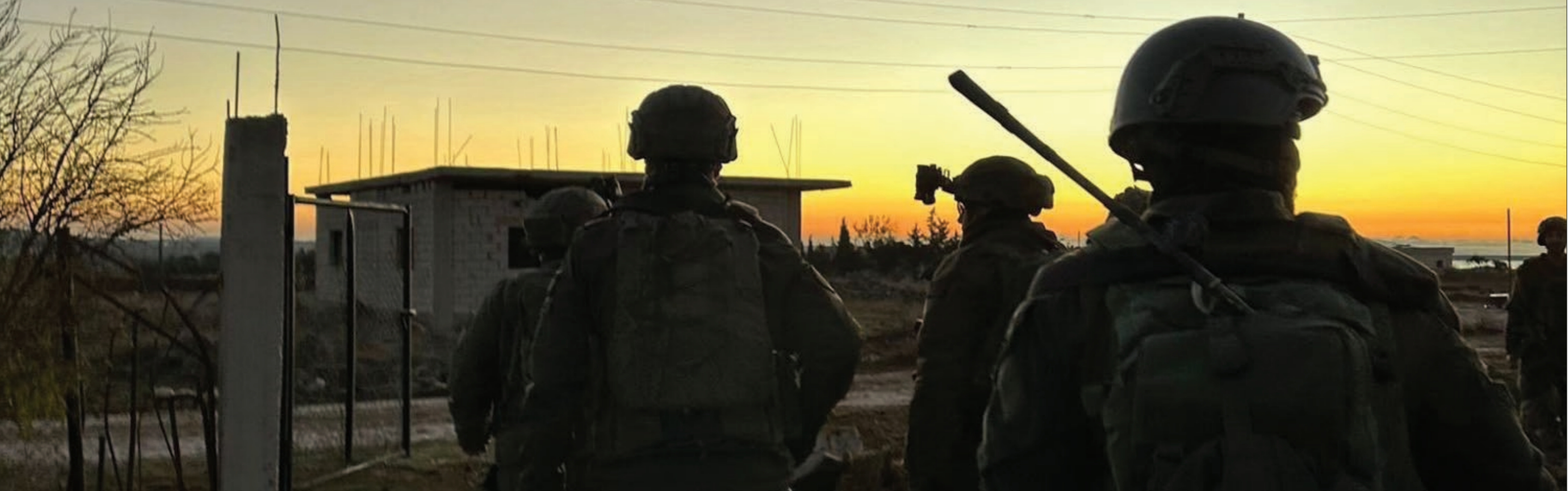
جودع عسكرية من الجيش الإسرائيلي في المنطقة العزلة جوبي سوريا- 9 كانون الأول 2024 أفدياج أرمي