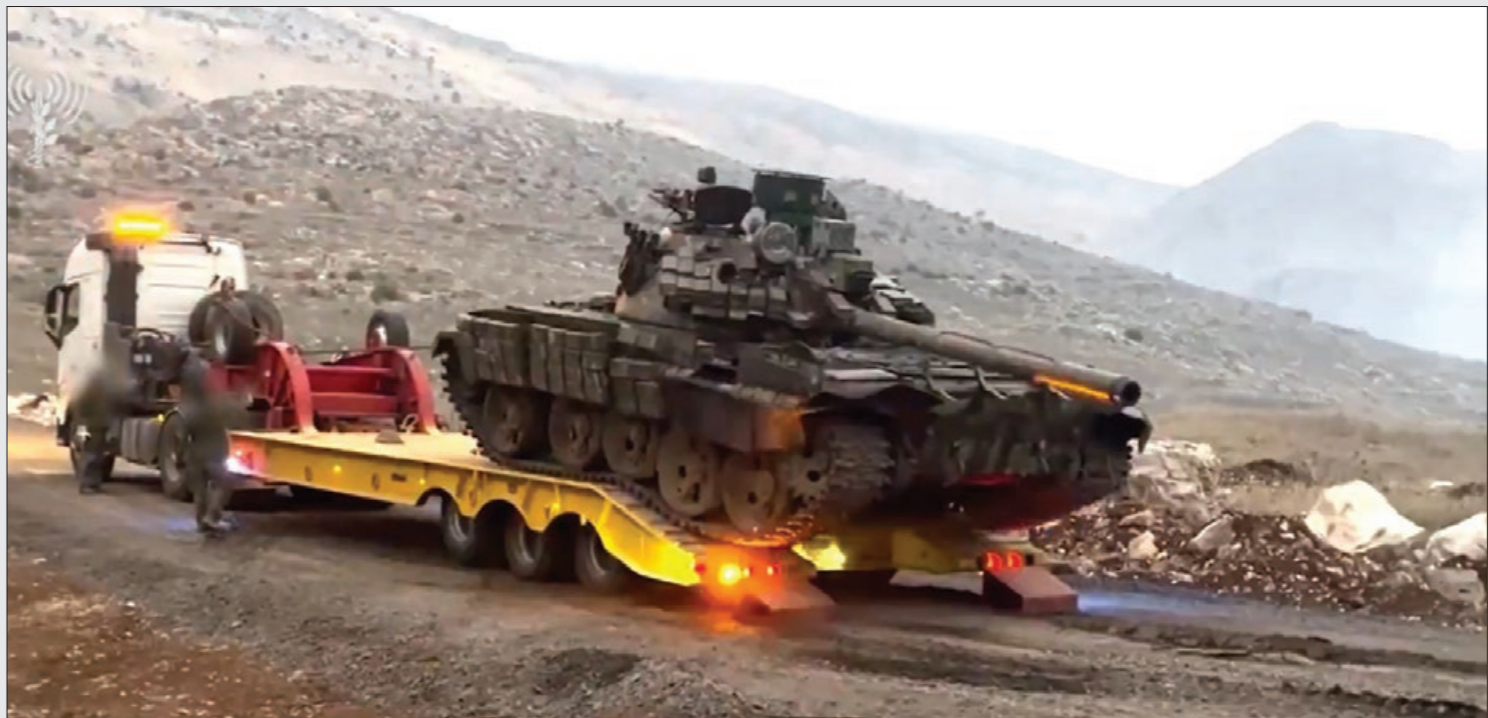
جود لإسرائيلون بصحارون جاية تركتها قوات النظام الموالي في محافظة القنيطرة جنوبي سوريا - 15 من كانون الثاني 2025 الجيش الإسرائيلي

ولفت طلاع إلى أن السيناريو الثالث هو أن تكون إسرائيل تستعد لـ"سيناريو الحرب الأهلية" في سوريا، وبالتالي انفلات القدرة على السيطرة على الحدود وغيرها من المخازن، مثل مخزون سلاح استراتيجي لا سيما السلاح الكيماوي