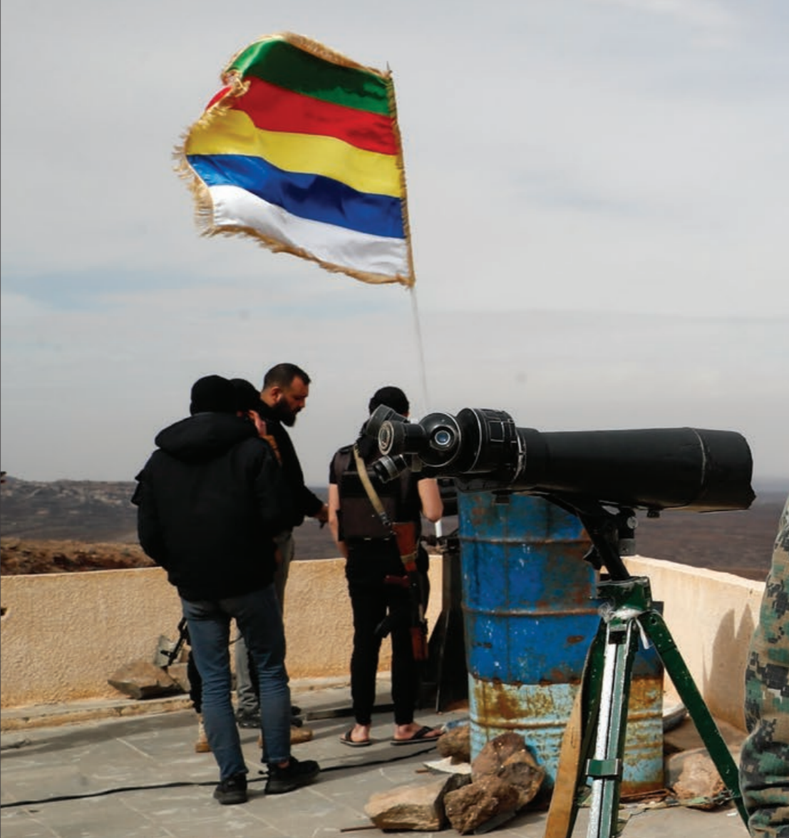
مقاتل من فصّل "أواه العبد" في السويداء جنوبي سوريا - 4 أفر 2025 APX

ولم يتوقف النظام عند هذا الحد، بل لجأ لأسلوب الاعتقالات التعسفية بحق الناشطين وطلاب الجامعات.