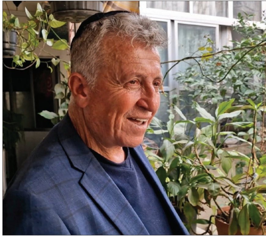
رجل سوري من الطائفة اليهودية في منزله بدمشق - 26 آذار 2025

ولا يعتبر موقع الكنيس مقدساً عند اليهود فحسب بل أيضاً عند بعض المسلمين لاعتقادهم بوجود مقام (مكان عبادة) الخضر عليه السلام بالمكان نفسه، كما أنه مقدس عند المسيحيين لوجود مقام أو المكان الذي اختبأ فيه النبي إلياس حسب اعتقادهم. وكان الكنيس في حي جوبير يرتاده زوار دبلوماسيون واليهود السوريون قبل أن يهاجروا.