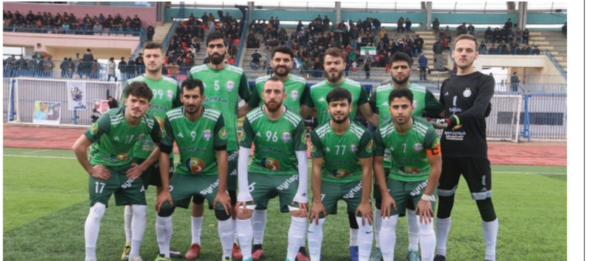
فريق خان شيوخون لكرة القدم خلال مباراة ودية ضد نادي الكرامة - 30 كانون الأول 2024، نادي خان شيوخون