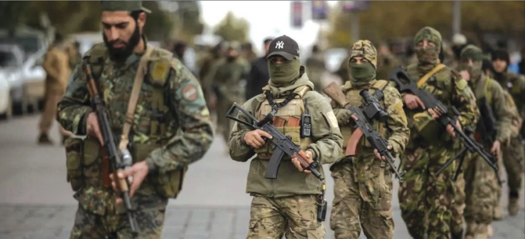
عناصر لفرقة العمليات العسكرية خلال عرض عسكري في وسط دمشق- 27 كانون أول 2024

عنب بلدي - السنة الرابعة عشرة - العدد 684 - الأحد 30 آذار / مارس 2025