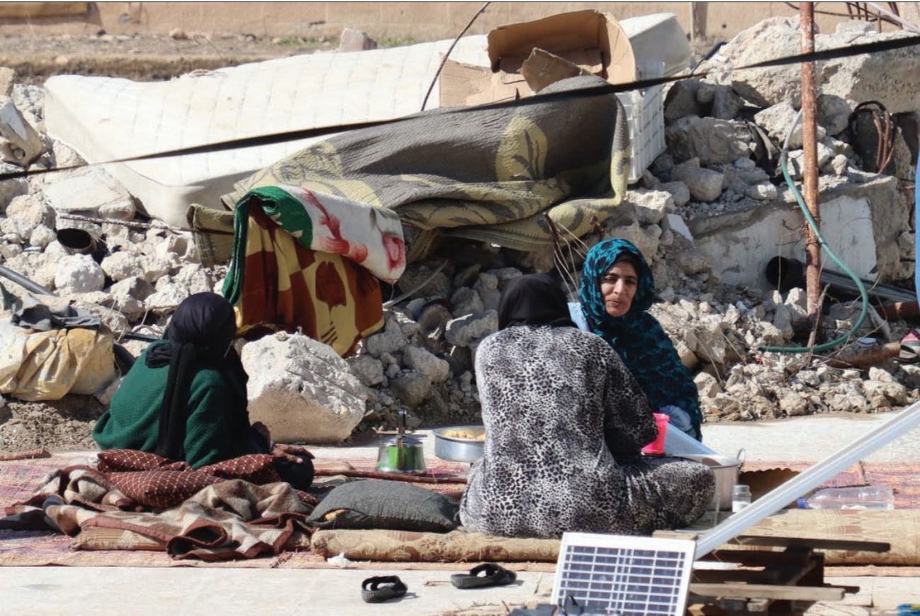
عند ن إلى ركام منازل في حية الحمصير ريف حمص بعد رحلة نزوح سنوات في مخيمات "عرسال" السابعة - 25 شباط 2025

وبيئهم منديون، من تسجيل انتهاكات تتعلق بمصادرة سيارات بصورة غير رسمية .