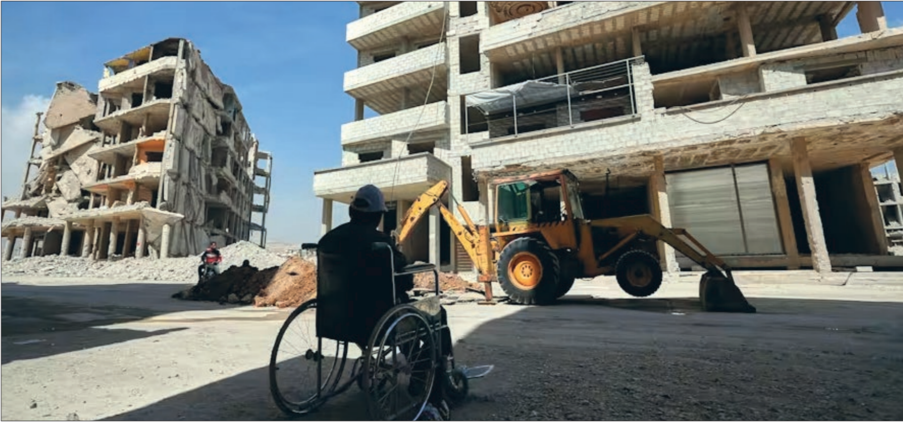
تصهت جون العائدة في مؤثر بروكسل ر 5.8 مليار يورو لسوريا وجول الجول – 17 أتم 2025 ليويزرا

عنب بلدي - السنة الرابعة عشرة - العدد 684 - الأحد 30 آذار / مارس 2025