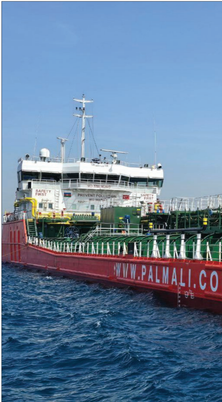
دليل وصول بخرة روسية محملة بالبترول إلى مرافأ بانياس - 25 من آذار 2025 (سانا)

على جانب الدعم القطري الذي لا يغطي الحاجة، جرى الحديث في الفترة التي أعقبت سقوط النظام المخلوع عن دور سعودي يحل محل الإيراني في تقديم إمدادات الطاقة، لكن هذا الحديث لم يبلغ مهاد الرسمي، في ظل عقوبات متعلقة بالحركة المالية والاقتصادية نحو دمشق، رغم تخفيف بعض الدول عقوباتها عن سوريا، وتحديدًا فيما يتعلق بالطاقة والتعاملات المالية، لكن