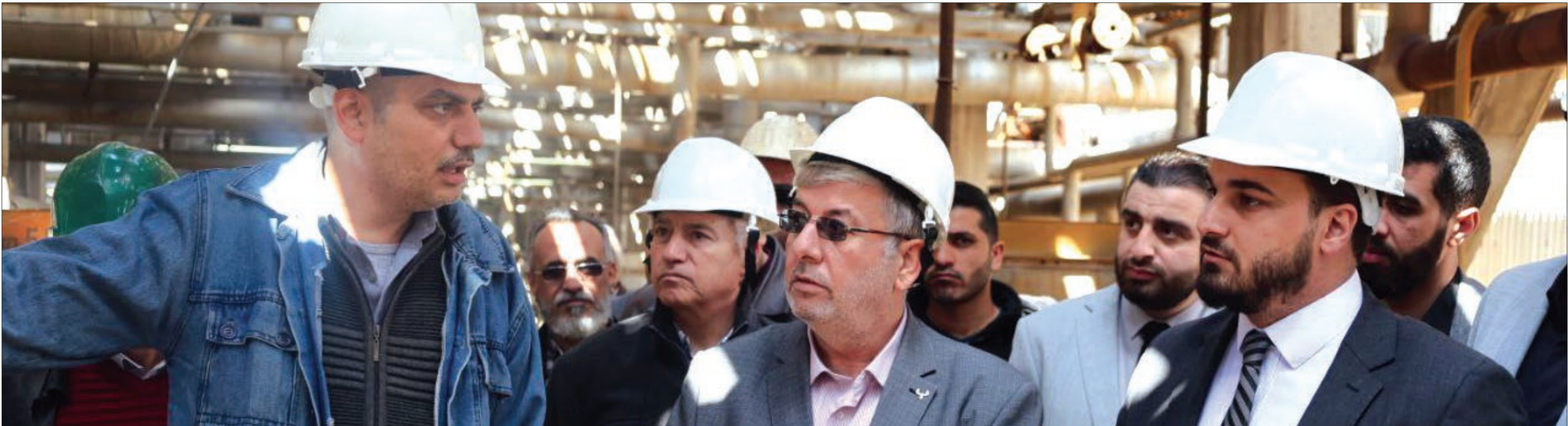
وزير النفط والثروة المعدنية في سوريا غيث حلال خلال زيارة تفحيفية لصفحة حمص وشركة الفوسفات المتواجد في المحافظة - 23 آذار 2025 أوزرة النفط والثروة المعدنية

يبلغ احتياطي سوريا من النفط نحو 2.5 مليار برميل وتحتل المرتبة 31 عالميًا في احتياطيات النفط العالمية، وتصل نحو 2.5% من إجمالي احتياطي النفط العالمي، وتحتل المرتبة 1.6 تريليون برميل.