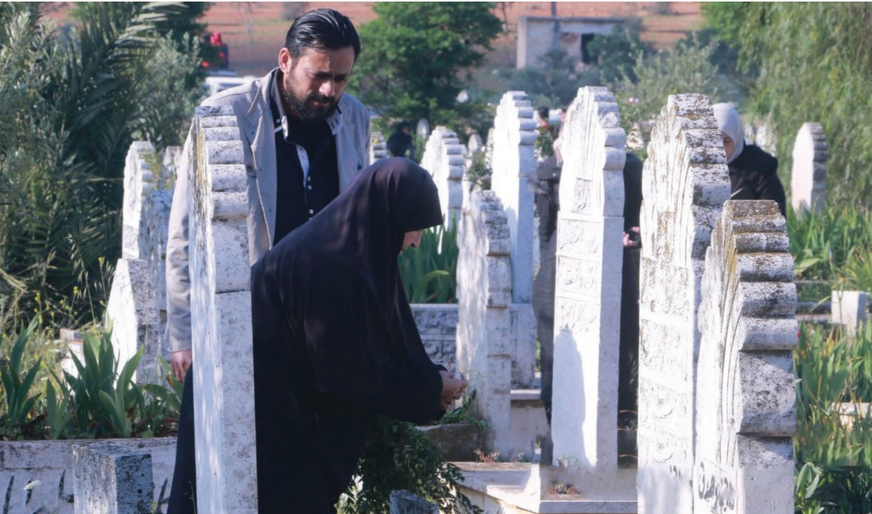
أهل يمضون نكات على القبور بعد صلاة عيد الفطر في حجة إيلب شمالي سوريا - 21 نيسان 2023

بلدته بعقريات، ثم دفنتها في مكان مجهول. حسين (شقيق حازم) قال لعنب بلدي، إن عائلته كانت تجبره مع إخوته الثلاثة على الخروج لزيارة قبر جده صبيحة العيد، وكانوا يتدمرون دناصًا، لكن سنوات مرت