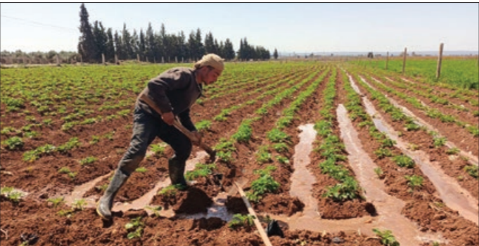
سلة محصول القطن في ريف درعا - 24 أفر 2025 نص فدي