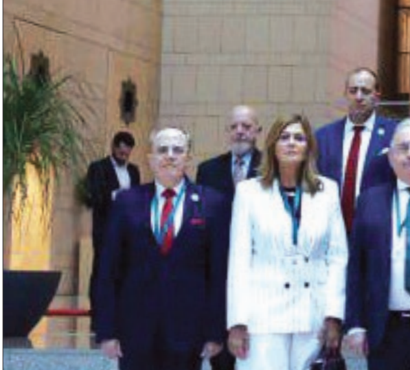
الرئيس السوري المرشح الانتقالي أحمد بشرع يحل حكومة بـ23 حقيبة وزارية – 30 أيار 2025 برئاسة الجمهورية،

وبجامعة "بلاد الشام" وكلية الحقوق في الجامعة العربية الدولية. يمتلك شركة عدة مؤلفات في مجال الطفل وحمايته، إضافة إلى المناهج التربوية، وله مشاركات في عدة لجان ومؤتمرات، منها في ألمانيا. تركو من مواليد عام 1979، وينحدر من مدينة عفرين شمالي حلب، ذات الغالبية الكردية، ويتكلم اللغات العربية والكردية والألمانية والإنجليزية. حصل على إجازة من كلية الحقوق من جامعة "دمشق"، والدكتوراة من جامعة "لايبزيغ" الألمانية.