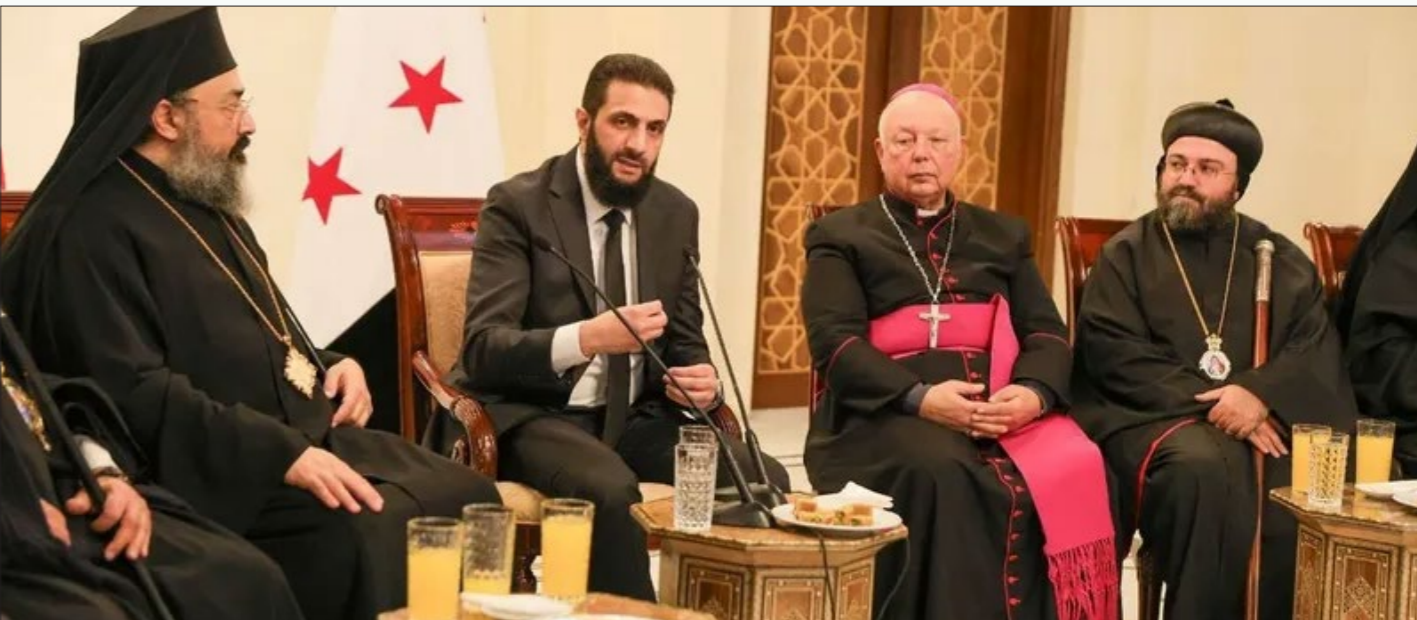
وفد من زعماء منظمة المسيحية في اجتماع مع الرئيس السوري أحمد طرف - 31 كانون الأول 2024 اسكيا

ال خليل قال أيضًا إن تفعيل دور المجتمع المدني لدعم المبادرات التي تعزز الوحدة الوطنية ونبذ التعصب، ولعب رجال الدين دورًا في التوعية بخطورة الطائفية وتجريم الدعوات التحريضية ذات الطابع الطائفي، يمهّد للوصل إلى حل للأزمة القائمة.