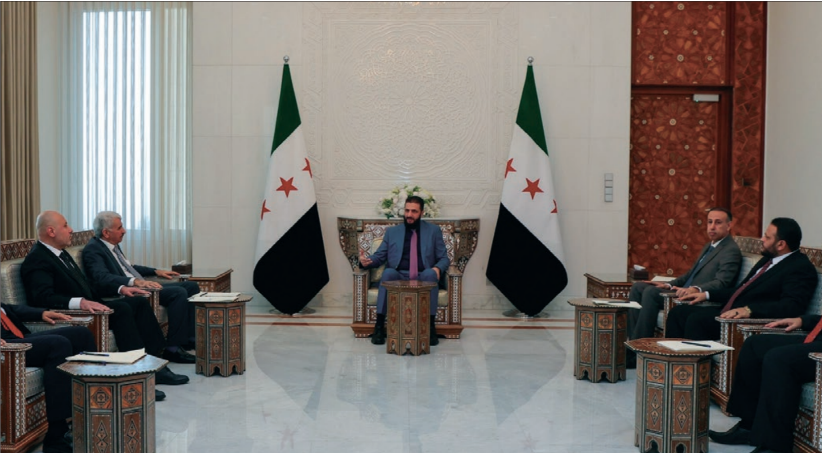
الرئيس السوري بشار الأسد يجلس مع أعضاء لجنة تقصي الحقائق - 10 آذار 2025 أسامة

وأوضح المتحدث باسم اللجنة، المحامي ياسر الفرخان، خلال مؤتمر صحفي عقد بدمشق، في 11 من آذار الحالي، أن اللجنة ستضع برنامجًا لمقابلة الشهود وكل من يمكنه المساعدة في التحقيق، وتحديد المواقع التي يجب زيارتها،