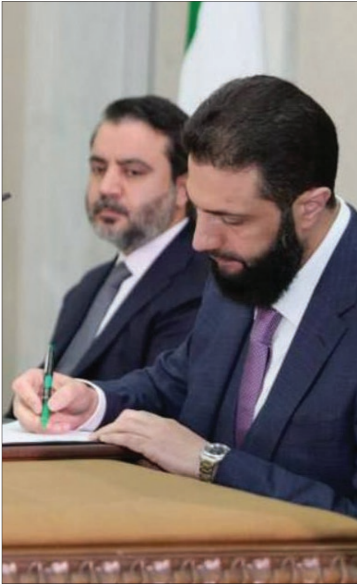
الرئيس السوري المرحلة الانتقالية أحمد الشرع يوقع على مسودة إعلان الدستوري - 13 آذار 2025 الجمهورية العربية السورية

واعتبر الأستاذ أن من الضروري في إطار هذه الانتقادات ملاحظة جانبين اثنين، الأول طبيعي ضمن نظام الحكم الرئاسي، وهو ضمن الصلاحيات التنفيذية بيد الرئيس لعدم وجود رئيس وزراء، أما الثانية فهي عدم وجود نص صريح لتولي رئيس الجمهورية لرئاسة مجلس القضاء الأعلى وهذه نقطة إيجابية لاستقلال السلطة القضائية. ولفتت إلى أن استمرار النص على تعيين