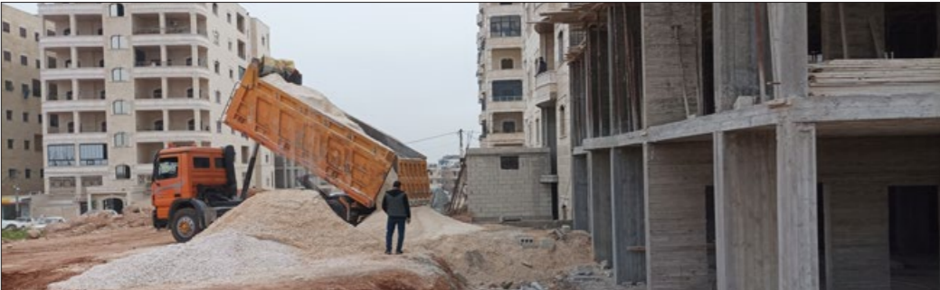
ارتفعت أسعار مواد البناء بسب زيادة الطلب عليها في الشمال السوري - 7 تم 2025