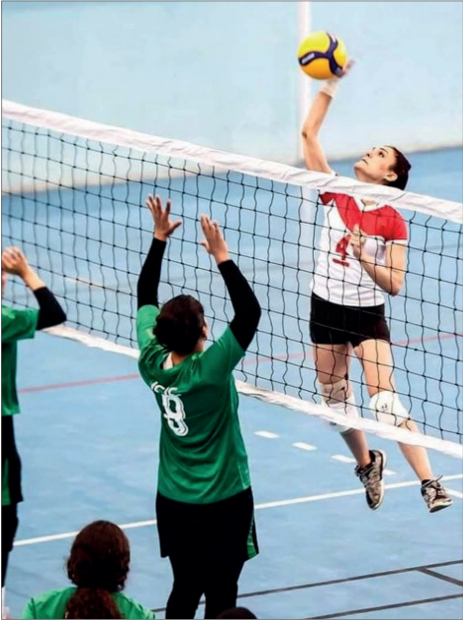
منتخب كرة الطائرة السوري السقوط خلال منافسات بطولة عرب آسيا - 2022

عنب بلدي - السنة الرابعة عشرة - العدد 682 - الأحد 16 آذار / مارس 2025