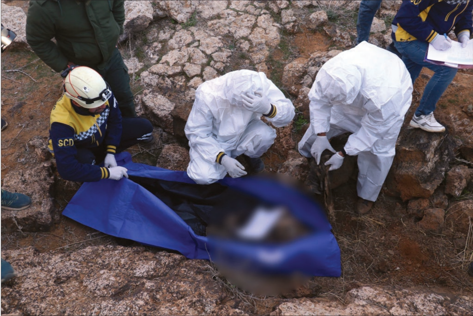
أنشطة فريق الدفاع المدني السوري لرفات تعود لضحايا مجهولي هوية من خلال طبعة عسكرية في ريف درعا -25 شباط 2025 الدفاع المدني

وأشار السلمو إلى أن خلال الأسبوع الماضي فقط، تم فتح أكثر من مقبرة جماعية من قبل مدنيين، ما أدى إلى العبث بمحتوياتها.