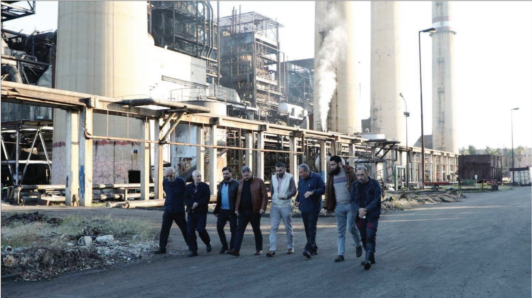
وزيرالكهرباء في حكومة دمشق المؤقتعمر شقروق أثناء زيرة تفحصه إلى محطة توليد بانياس – 21 كانون الأول 2024 ثورة الكورنايا

عنب بلدي - السنة الرابعة عشرة - العدد 682 - الأحد 16 آذار / مارس 2025