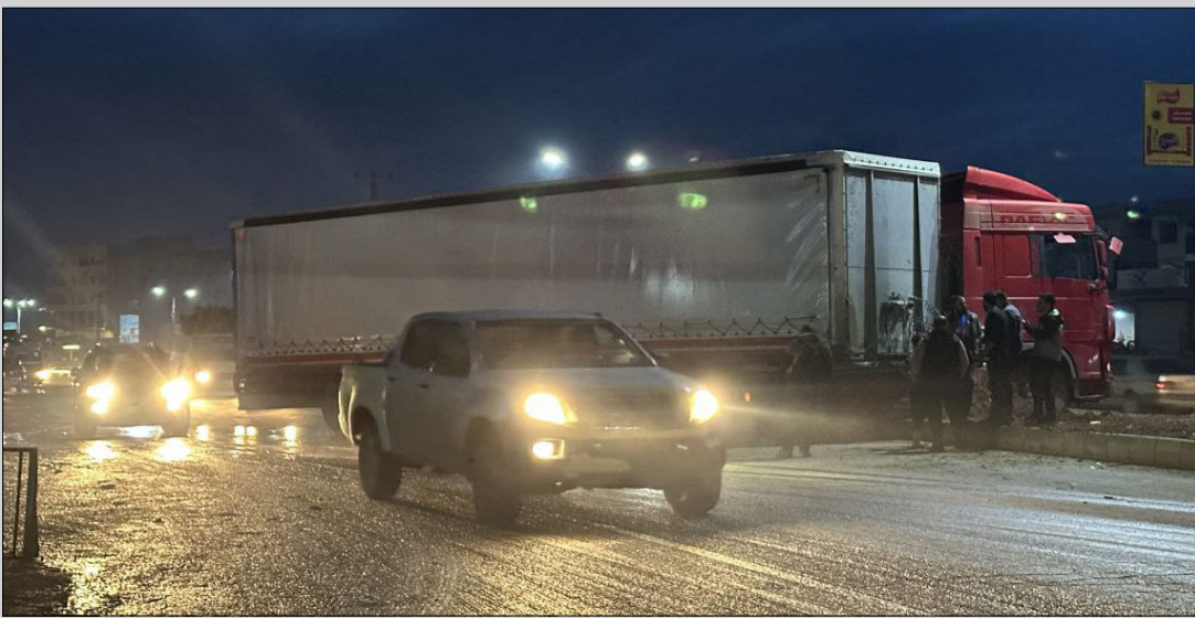
ازدحام مروري في مدينة اعزاز بريف حلب الشمالي - 11 من كانون الأول 2023

وأضاف المصدر أن هذه الظروف "الاستثنائية" تظهر كعائق أمام إرساء النظام المروري الفعال، وتعزز حالة الفوضى وغياب التطبيق القانوني. وتشهد اعزاز كما مناطق سيطرة المعارضة في شمال غربي سوريا حوادث طرقية، نتيجة انخفاض الالتزام بقوانين السير وضعف التنظيم المروري وزيادة عدد السكان، وعدم ضبط الدراجات النارية، إضافة إلى وجود الطرقات الترابية وضعف تجهيز بعض الطرقات المعبدة، خاصة التي تعرضت لقصف من قبل قوات النظام.