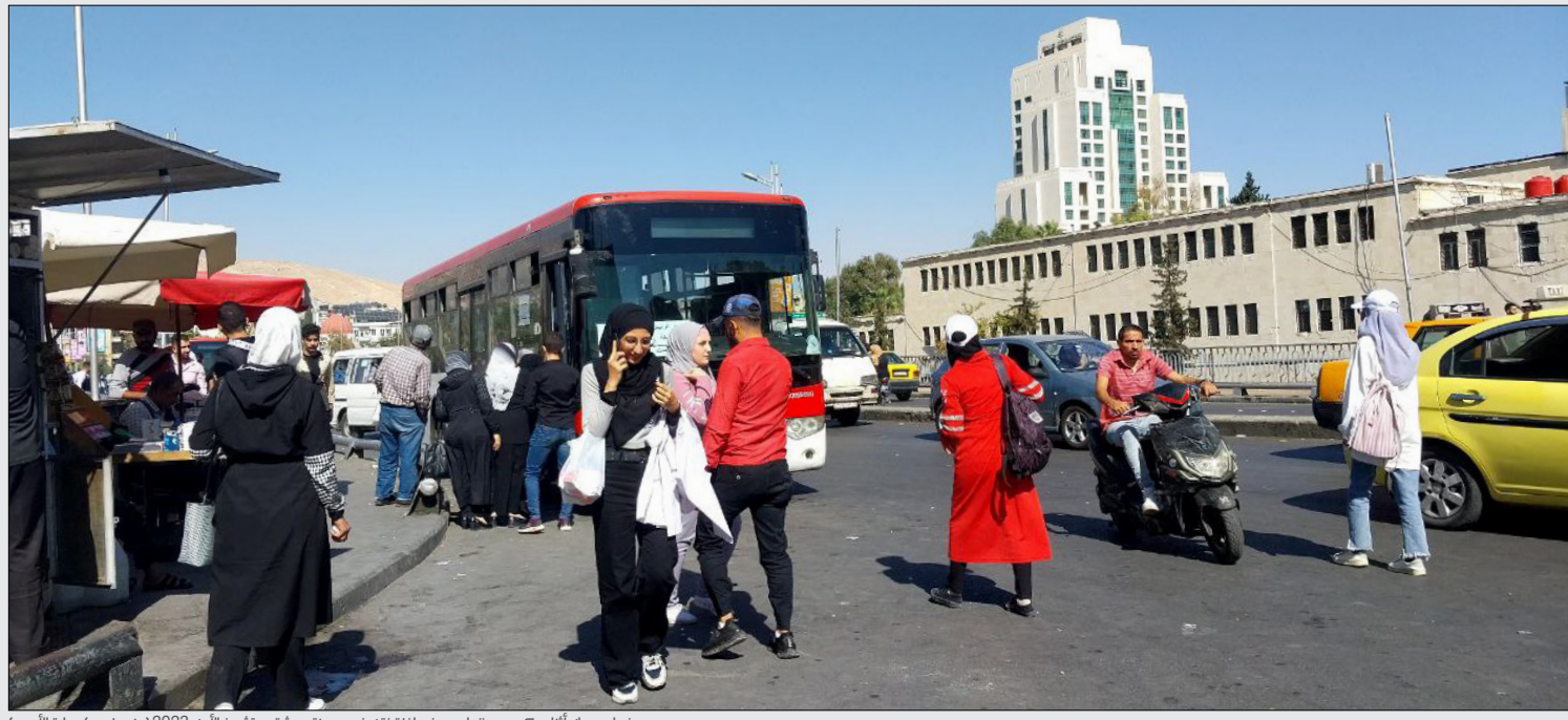
نساء ورجال أثناء ركوبهم ونزولهم من حافلة نقل في مدينة دمشق - تشرين الأول 2023