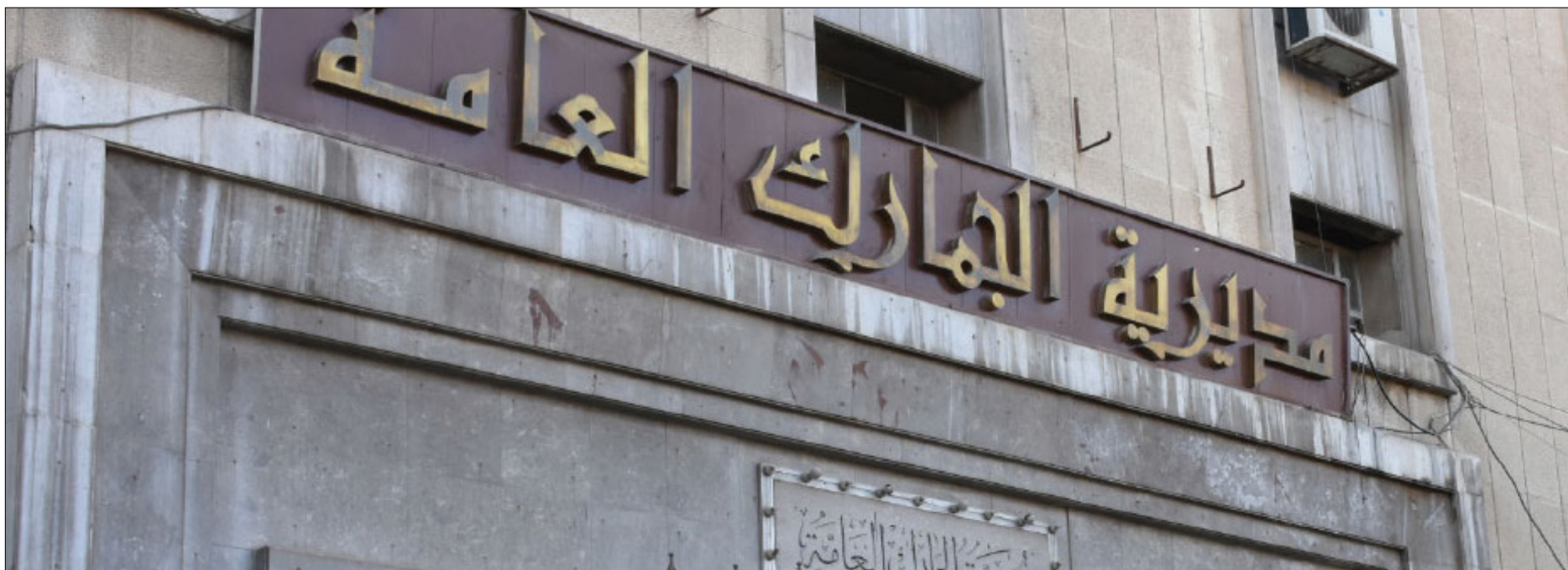
مبنى مديرية الجمارك العامة بدمشق