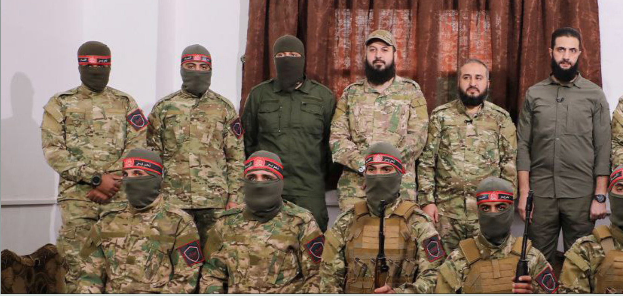
القائد العام لـ"هيئة تحرير الشام" أبو محمد الجولاني خلال تكريم عناصر "العصائب الحمراء" في إدلب - تشرين الثاني 2022 (أمجاد)