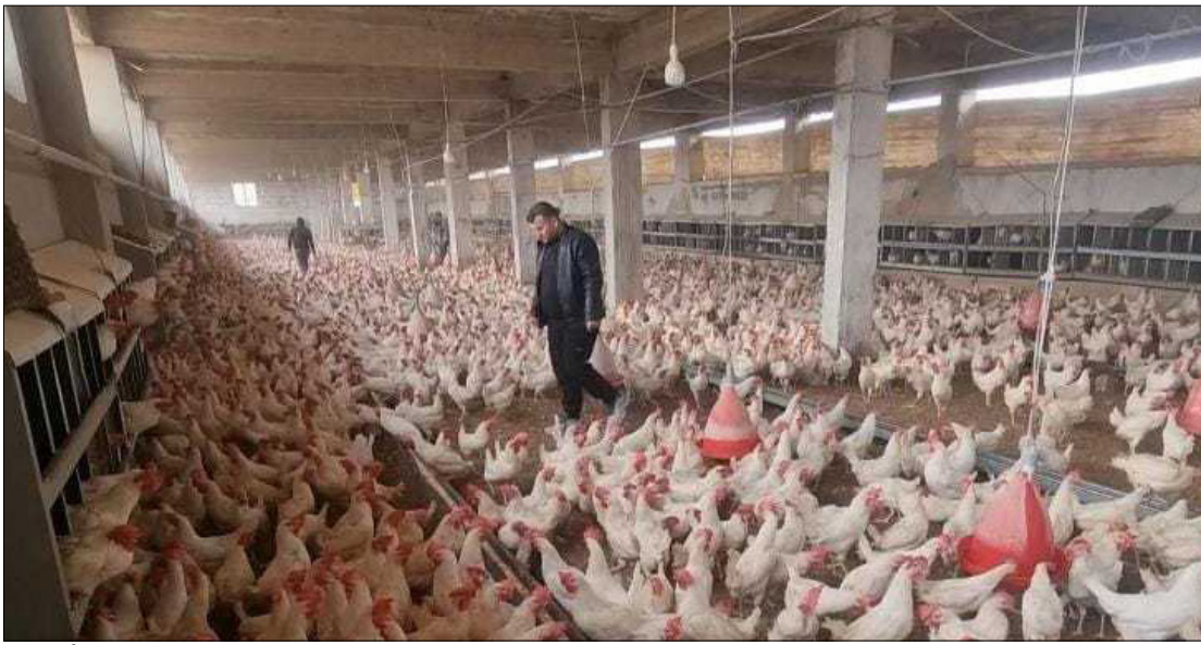
مدجنة في ريف إدلب شمال غربي سوريا - كانون الأول 2023

سعر الطن إلى 120 دولاراً أمريكياً. تشهد منطقة شمال غربي سوريا تدهوراً في الوضع الاقتصادي، وهو ما أثر سلباً على جميع جوانب الحياة. ويشهد المستوى العام للأسعار ارتفاعات متكررة تطال مجموعة من السلع والمواد الأساسية والغذائية، ويزيد هذا الارتفاع من صعوبة قدرة السكان على الشراء، ما يدفع معظمهم إلى الاعتماد على مصادر متعددة لمحاولة تحقيق توازن بين الدخل والنفقات.