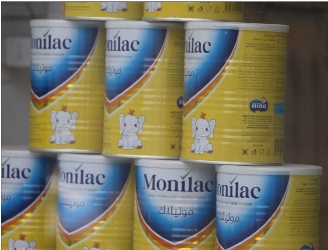
حليب مجفف الأطفال داخل صيدلية في مدينة رأس العين - كانون الأول 2023

وذكرت المنظمة في بيان لها، أن أكثر من 3.75 مليون طفل في جميع أنحاء البلاد كان يحتاج إلى مساعدات غذائية قبل الزلزال، وتوقعت أن يتفاقم الوضع وتزداد صعوبة الوصول إلى الخدمات الصحية والتغذوية الأساسية في نهاية عام 2023.