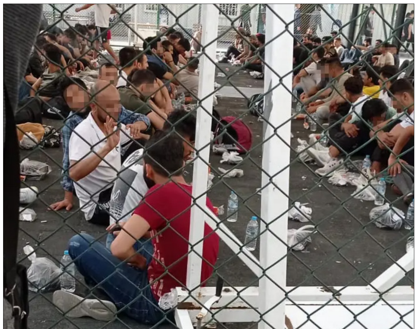
مهاجرون ولاجئين محتجزون في ملعب لكرة السلة أثناء انتظارهم في مركز الإبعاد في تورلا - من حزيران 2022