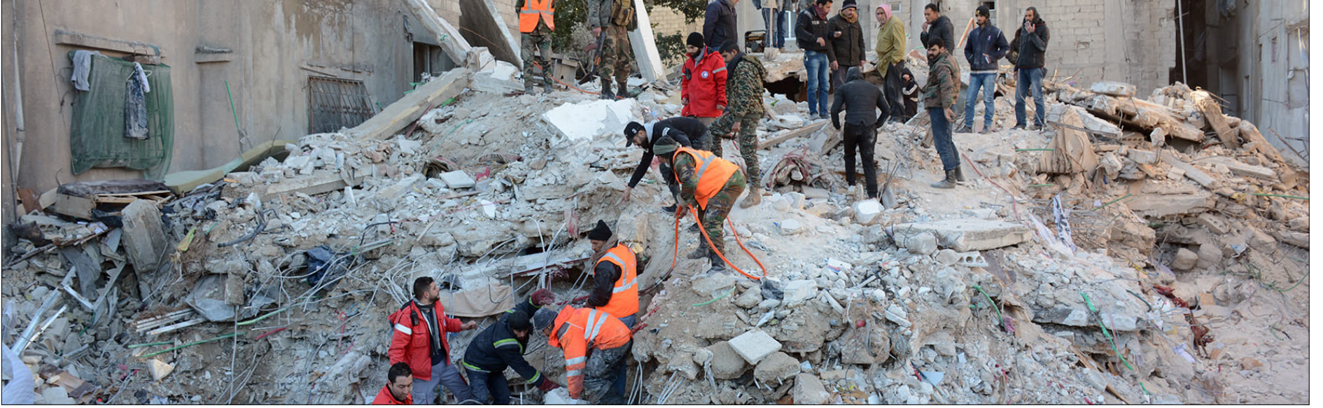
عمليات البحث عن عالقين تحت الأنقاض إثر الزلزال في مدينة اللاذقية - 8 من شباط 2023