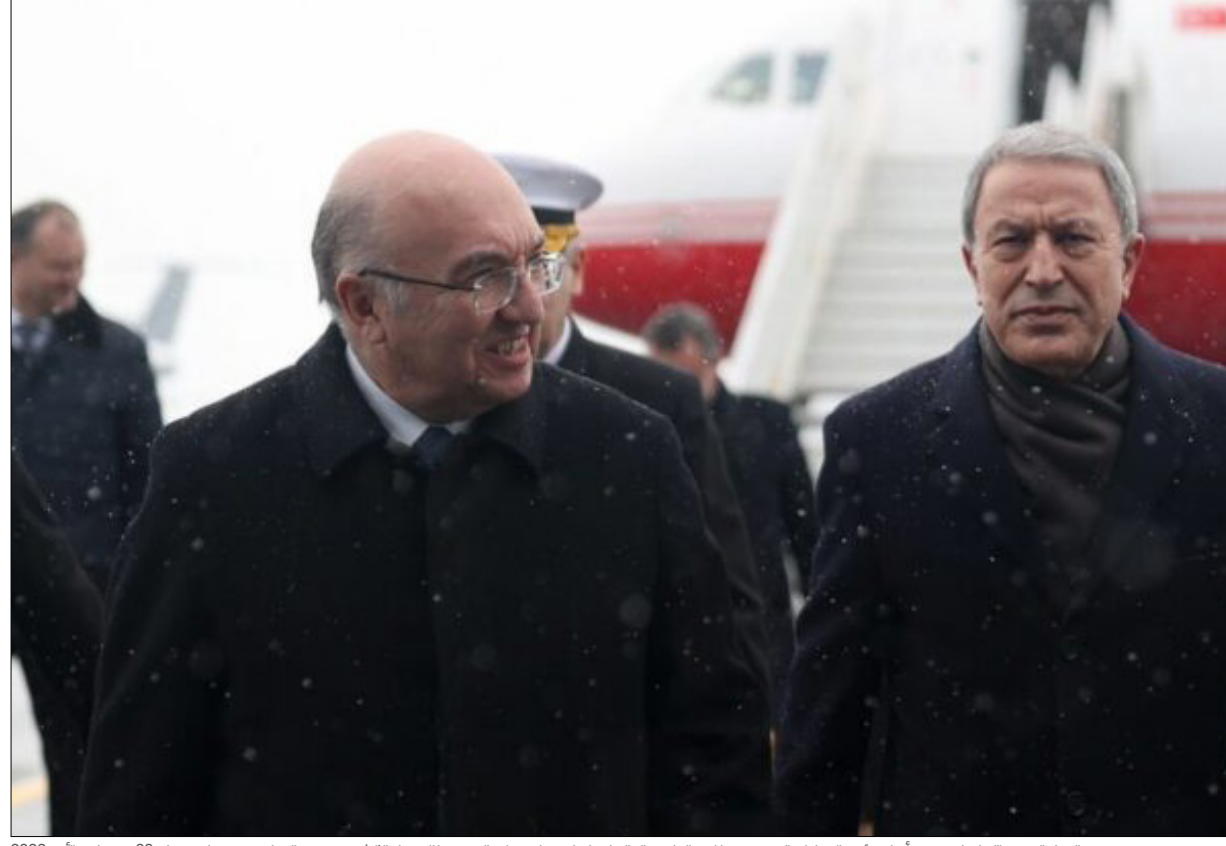
وزير الدفاع التركي السابق، خلوصي أكار، ورئيس المخابرات التركية حينها وزير الخارجية الحالي، صاكان فيدان، يصلان إلى روسيا للاجتماع الثلاثي مع وزير الدفاع في روسيا وسوريا - 28 من كانون الأول 2022

"وصل مسار التقارب إلى نقطة ينبغي معالجتها قبل الانطلاق لتطويع المسار، وعقدت لقاءات إضافية، وتتجلى بالاتفاق على خارطة طريق، ولن