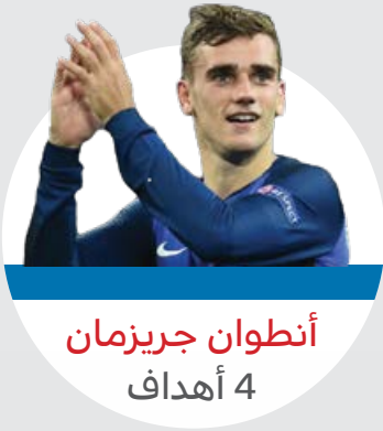
أنطوان جريزمان 4 أهداف