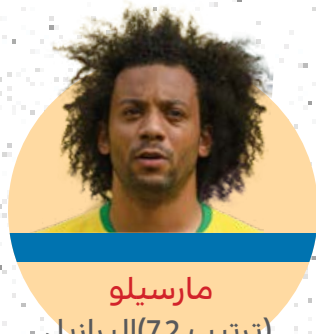
مارسيلو (ترتيب 7.2) البرازيل