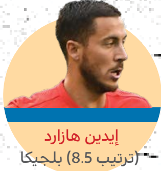
إيدن هازارد (ترتيب 8.5) بلجيكا