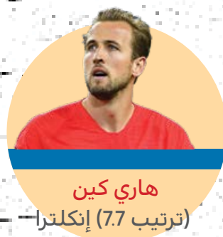
هاري كين (ترتيب 7.7) إنجلترا