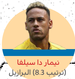
نيمار دا سيلفا (ترتيب 8.3) البرازيل