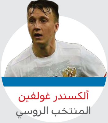
ألكسندر غولفين المنتخب الروسي

بعد انتهاء دور المجموعات والانتقال إلى الأدوار الإقصائية حتى المرحلة النهائية برز عدد من اللاعبين الشبان خلال النهائيات العالمية مما جعل الكثير من التوقعات تدور حول لمعان نجمهم في المسابقات الكروية