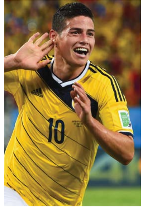
اللاعب الكولومبي خامس رودريجز

التعاقد مع الكولومبي خاميس رودريغوز وجعل منه أحد نجوم تشكيلته، وذلك عقب الأداء المذهل الذي قدمه اللاعب بألوان منتخب بلاده في كأس العالم 2014 بالبرازيل. ويعتبر توقيع النادي الملكي مع اللاعب الكولومبي خير دليل على أن تقديم أداء جيد في الموندiales كفيل بتغيير مسيرة لاعب كرة القدم. وبعد انتهاء مونديال كأس العالم، بدأ جليًا أن هناك الكثير من المواهب والجواهر التي برزت ووجدت نفسها على لوائح المتنافسين في السوق الكروية الأوروبية والعالمية، لتسير بذلك على خطى رودريغز.