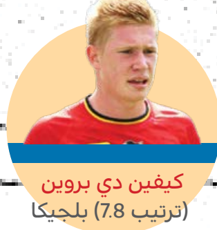
كيفين دي بروين (ترتيب 7.8) بلجيكا