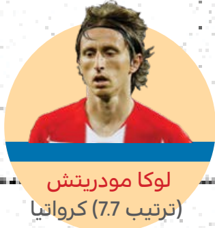
لوكا مودريتش (ترتيب 7.7) كرواتيا