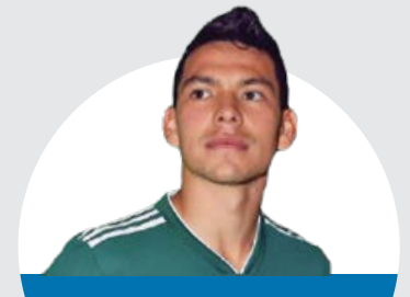
هيرفينغ لوزانو المنتخب المكسيكي