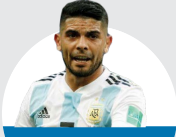
إيفر بانيجا المنتخب الأرجنتيني