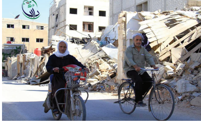
يصر عدد من أهالي داريا على البقاء بداخلها رغم سوء الأوضاع الأمنية والإنسانية

المدينة وطريق المعامل أثناء عمليات التمشيط المستمرة بين أفراد الجيش الحر وعناصر كتائب الأسد، إذ تم يوم الأربعاء 12 حزيران تحرير بعض الأبنية التي كان يتحصن بداخلها عناصر كتائب الأسد وقتل كل من كان فيها، وكانت اشتباكات عنيفة قد دارت يوم الاثنين 10 حزيران على الجبهة الغربية حيث قام عناصر الجيش الحر بالتصدي لمحاولة تسلل لعناصر قوات الأسد من تلك الجبهة والإيقاع بهم بين قتيل وجريح، إذ تم رصد سيارات إسعاف تنقل جثثاً ومصابين باتجاه مدينة صحنيا المجاورة، كما دارت اشتباكات متقطعة في محيط مقام سكيكة وفي محيط ساحة الحرية (شريدي)، وساد باقي الجبهات هدوء رغم تخلله عمليات قنص متبادلة. على صعيد آخر استقبل المشفى الميداني في المدينة الأسبوع الفائت 10 جرحى من المدنيين والمقاتلين، استشهد اثنان منهم في وقت لاحق نظراً للإصابات الخطيرة التي تعرضوا لها.