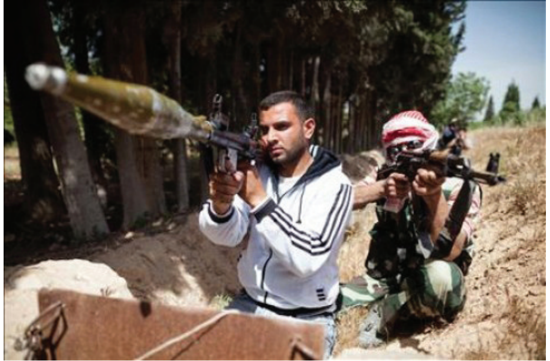
الجيش الحر يتوقع أن يتم تسليمه بندق وذخائر بدل الأسلحة الثقيلة

وبأني القرار الأمريكي بتسليح المعارضة السورية بعد يوم واحد من إعلان الجهاد ضد النظام السوري والذي أقره العلماء المسلمون في مؤتمر «موقف علماء الأمة من القضية السورية» الذي عقد في مصر يوم الخميس 13 الشهر الجاري