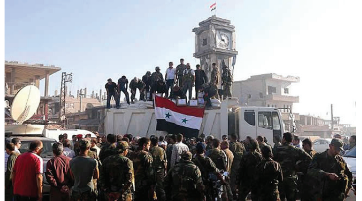
يشعر الحمصيون بقرب الخطر منهم ويتخوفون تفرّد النظام بحمص بعد سيطرته على القصر