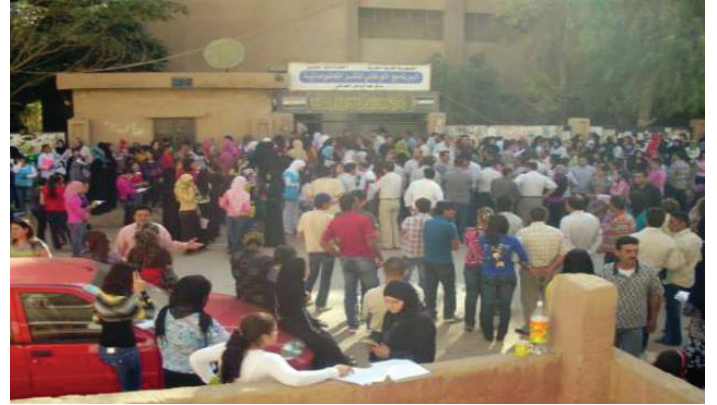
أعداد المتقدمين الكبيرة وقلّة عدد المراكز حولت الامتحانات في الحسكة إلى فوضى