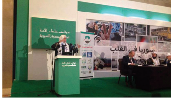
الشيخ أسامة الرفاعي في مؤتمر «موقف علماء الأمة من القضية السورية»

وجه لفيق من العلماء والدعاة المسلمين رسائل شديدة اللهجة في مؤتمر «موقف علماء الأمة من القضية السورية» الذي انعقد الأربعاء 12 حزيران في العاصمة المصرية القاهرة، وأعلن المجتمعون وجوب الجهاد في سوريا، معتبرين ما يجري هناك