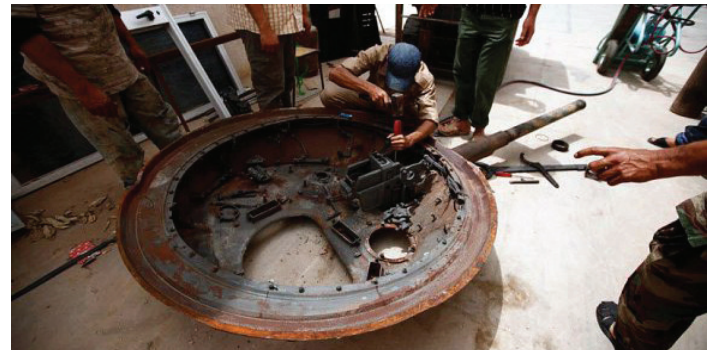
مقاتلون يحاولون الاستفادة من مخلفات قوات الأسد في تصنيع الأسلحة