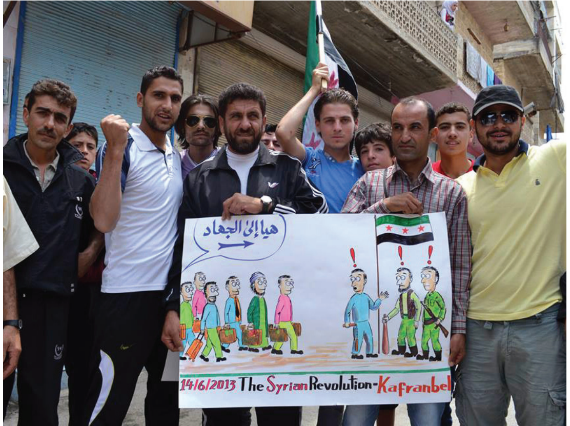
من مظاهرات جمعة «جمعة المشروع الصفوي تهديد للأمة» - كفرنبل 14 حزيران 2013

واقع النزوح واضطرابات التكيف عند الأطفال