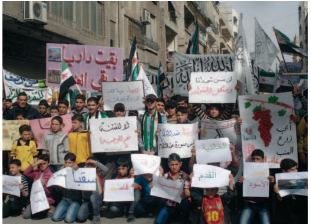
من مظاهرات جمعة «داريا: أخوة العنب والدم» - داريا

343 مظاهرة سجلت في 300 نقطة على امتداد البلاد سقط خلالها 182 شهيدًا بينهم 12 طفلًا و 8 سيدات