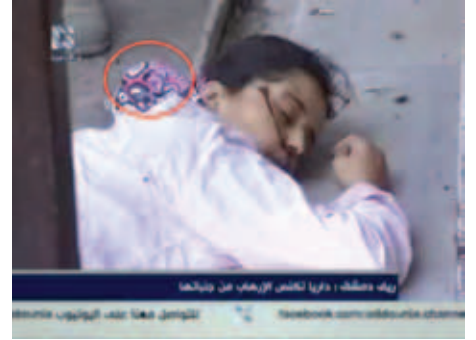
الفتاة الغربية التي تم قتلها بعد اغتصابها من قبل قوات الأسد

يتابع أبو علي حديثه: عندما نزلت الفتاة من الشقة بعد أن أخذها ذلك الجندي، كانت ثيابها ممزقة وكنزتها لا تستر كامل بطنها، وبعد أن توجهت إلى الضابط وتحدثت إليه، أشارت إلينا بأنهم يقتلون الناس خارج هذا الزقاق ثم صارت تبكي وتقول «اغتصبوني»...!!!