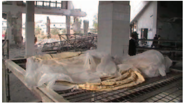
النظام يعاقب المدن التي يسيطر عليها الجيش الحر من خلال إتباع سياسة التجويع بقصف المخابز الرئيسية

استهدفت مدفعية وصواريخ النظام يوم الأربعاء 31 تشرين الأول 2012 الفرن المركزي في كفر حمرا في حلب ما أودى بالعشرات بين شهيد وجريح بينهم امرأة وطفلاً. تلاه قصف جوي استهدف أكبر المخابز في الأتارب سقط فيه عشرة شهداء والعديد من الجرحى. هذا بالإضافة إلى تدمير المخبز وتعطيله عن العمل، لكن سرعان ما أعاده أهالي المنطقة بمساعدة الثوار وأفراد الجيش الحر إلى الحياة ليعمل من جديد رغم الدمار. ويبدو أن نظام الأسد عمد إلى سياسة جديدة في الآونة الأخيرة بعد أن جرب كافة الوسائل الممكنة لقمع ثورة الشعب ضد نظامه ألا وهي استهداف المخابز والأفران في المناطق الثائرة ليضرب عصفورين بحجر واحد، تدمير تلك الأفران وقتل المزيد من المدنيين الذين كانوا قد اصطفوا في طابور