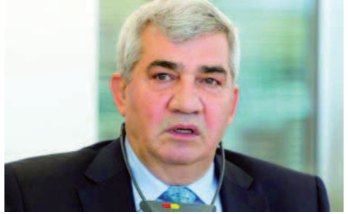
تضم المبادرة اجتماع أكثر من ٥٠ شخصية، ١٥ مقعداً للمجلس الوطني، ١٤ ممثلاً عن المحافظات، ٢٠ مقعداً لنشطاء الداخل

بعد قرابة عام من تأسيس المجلس الوطني السوري الذي بارك تأسيسه الثوار في كافة أنحاء البلاد ورفعوا لافتات وشعارات تحييه وتطالب به لا بل وأطلقوا شعار «المجلس الوطني السوري يمثلني» على أحد أيام الجمع، وبعد أن فشل أعضاء هذا المجلس في التوصل إلى اتفاقية تجمع شمل المعارضة وتوحدتها تحت سقف واحد، أعلن الخميس الأول من تشرين الثاني ٢٠١٢ ومن العاصمة الأردنية عمّان عن مبادرة أطلقها المعارض السوري والسجين السياسي السابق