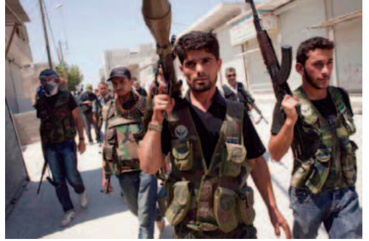
بعض قيادات الجيش الحر كانت لهم اليد الكبرى في تأخير النصر